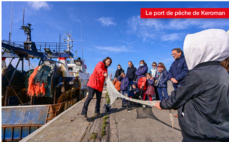
Le port de pêche de Keroman

Partez en immersion dans l'un des plus grands ports de pêche français pour comprendre le parcours du poisson de la mer à l'assiette. Découvrez les techniques de pêches, le système des ventes et comment les différentes espèces sont transformées avant d'être expédiées.