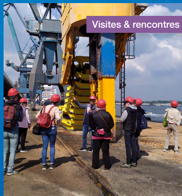
Visites & rencontres