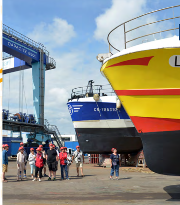
L'aire de réparation navale de Keroman